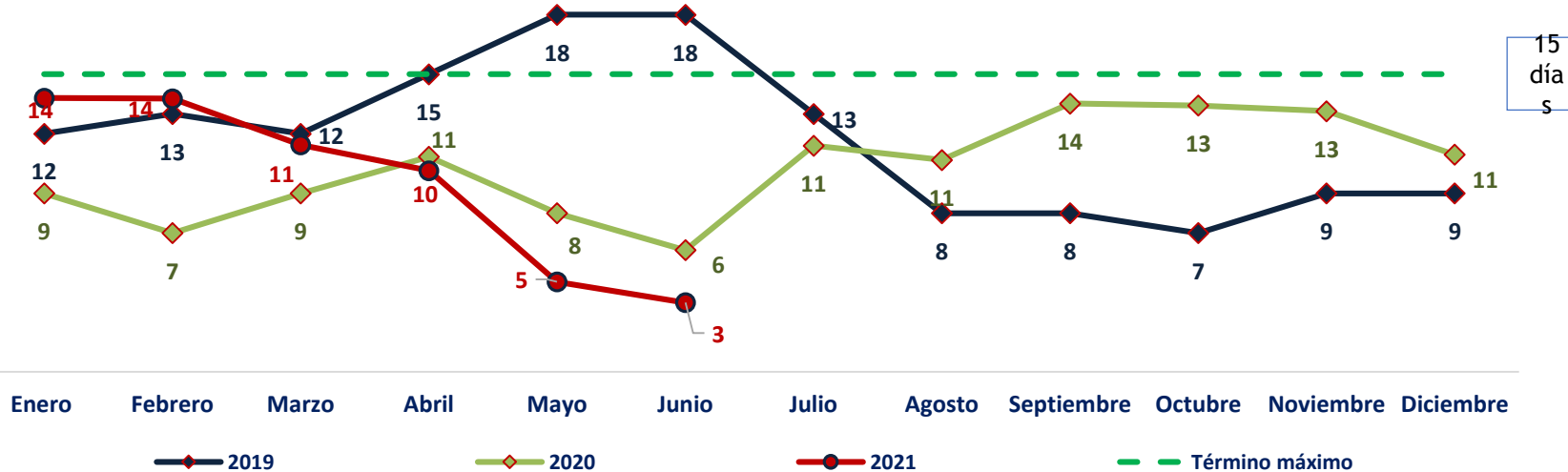
Tiempo de respuesta Quejas y Reclamos